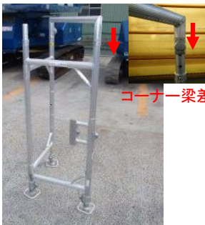
コーナー梁差込み